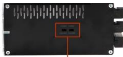
RS-232/485 select switch