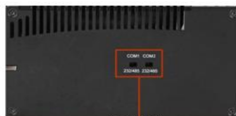
RS-232/485 select switch